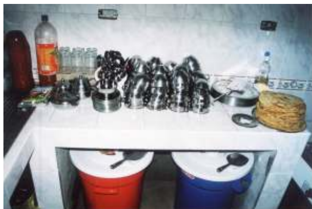
De pannenkoeken zijn gebakken in de nieuwe keuken.