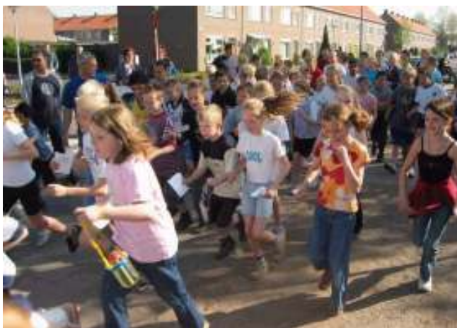
Kinderen van de Bitswijkstraat school houden sponsorloop.

Ook dit jaar waren twee andere basisscholen bereid een actie te houden voor de opvang van de wijkkinderen van Zarzuela. Op de Bitswijkstraat school is met een sponsorloop door de kinderen een groot bedrag bij elkaar gerend.