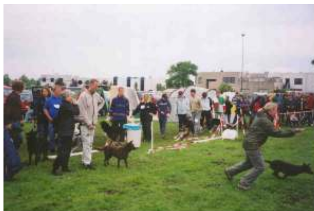
Hier moedig ik de hondenbezitters aan voor de piekenrace.