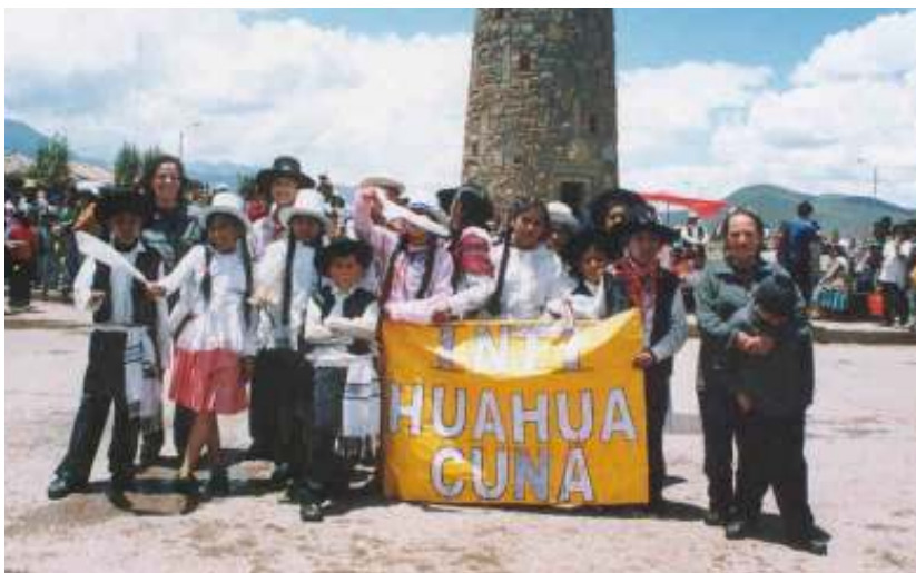
De kinderen zeer voldaan na een danswedstrijd.