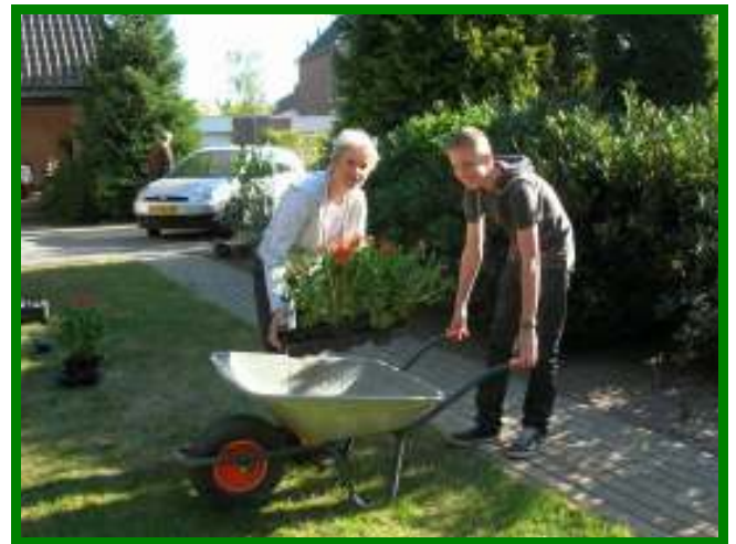
Leerlingen brengen de verkochte geraniums rond

In de maand april heeft weer de jaarlijkse geraniumactie van het Zwijsen College in Veghel plaatsgevonden.