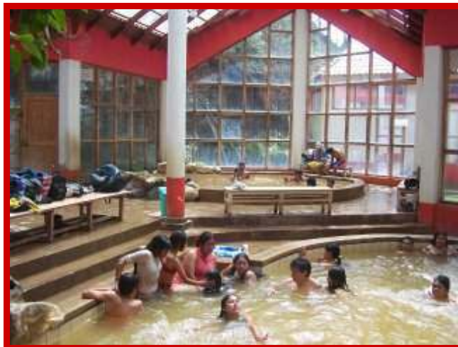
De thermale baden in Machacancha

plek schoonmaken, omdat we naar de warme baden in Machacancha zouden gaan.