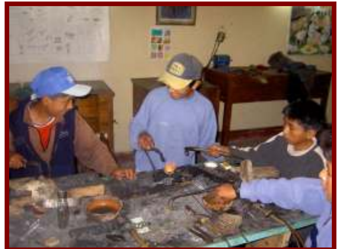
Zilvermedlessen bij een echte zilversmid

Dan zou ik voor dit geld een eigen groter opvanghuis kopen. Hierdoor zouden we niet meer afhankelijk zijn van de goodwill van de wijkpresident en alle bewoners van Zarzuela. Het zou prachtig zijn als we dan extra ruimte zouden hebben om vakopleidingen te verzorgen voor de kinderen, zoals timmerlessen. Mocht ik nog geld overhouden dan zou ik dat besteden aan meer workshops, gericht op de toekomst van het kind. Ik zou dan een leraar zilvermeden vast in dienst nemen, die de kinderen lessen zilvermeden kan geven waardoor de kinderen hun spullen beter kunnen verkopen. Hiermee zouden zij en de gezinnen waarin ze wonen een toekomst krijgen.