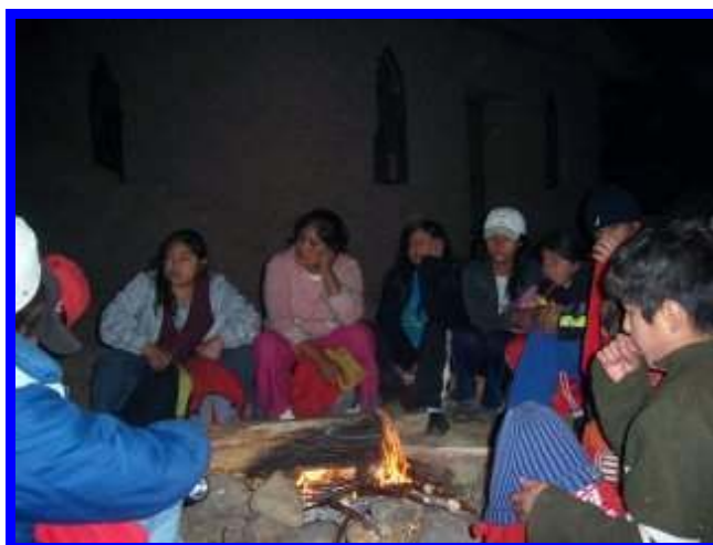
Spannende verhalen bij het kampvuur

We moesten klimmen en heel veel rondjes lopen en we kwamen doodmoe eindelijk bij het kampeerterrein aan. Het was een heel mooie plek en de profesoras waren al bezig de tenten op te zetten.