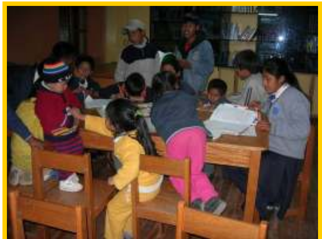
De kinderen maken hun huiswerk

Meer opleidingen voor het team en meer nieuwe boeken in de bibliotheek, niet alleen voor Inti Huahuacuna maar zeker ook voor Inti Ñan. Onlangs zijn de kinderen van Inti Ñan uit de wijk Tica Tica een bezoekje komen brengen aan Inti Huahuacuna in de wijk Zarzuela en het raakte me enorm te zien hoe geëmotioneerd deze kinderen waren bij het zien van de mogelijkheden die wij de kinderen in dit opvanghuis kunnen bieden.