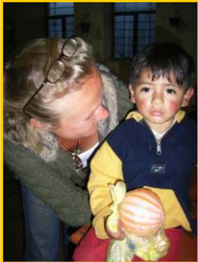
Fleur en een van de niños van Inti Ñan

Ik had van mijn oom en tante een geldbedrag gekregen om daar iets mee te doen wat ik dacht dat goed was. Dat kwam goed uit, want ik zag dat de honger van de kinderen groot is. Het eerste wat ik hiervan gedaan heb is een bijdrage geleverd aan de continuering van het eetproject van Inti Ñan. Het zien van de gezichtjes van de kinderen als ze eten krijgen was hartverscheurend en een openbaring voor mij.