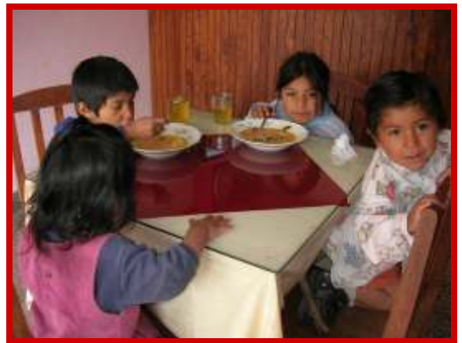
Een extra maaltijd voor ondervoede kinderen

Dat Inti Huahuacuna in de toekomst nog verder door mag groeien. Het is zo fantastisch als je ziet wat wij als team, tezamen met alle mensen die ons helpen, al bereikt hebben. We moeten ons land positief zien te veranderen en het is prachtig om te zien hoe mooi dit binnen Inti Huahuacuna en in de wijken waar onze kinderen wonen al heel voorzichtig een beetje lukt. Met de hulp uit Nederland kunnen wij steeds meer mogelijkheden bieden aan onze kinderen en ik zou dan ook dit bedrag besteden aan de uitbreiding van ons werk en de groei van Inti Huahuacuna.