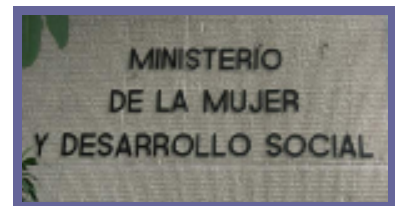
Gesprek met het ministerie