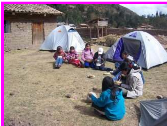
Het tentenkamp in Totora

de reis konden we veel dieren zien en prachtige landschappen.