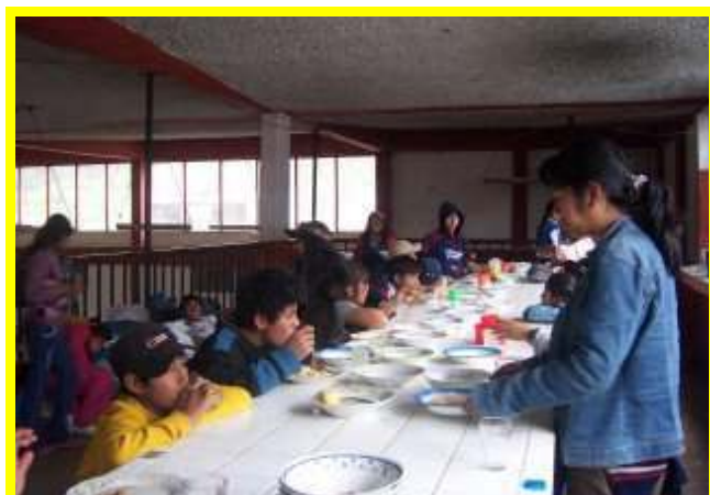
Lekker eten is echt lekker

De tijd vloog en we moesten alweer vertrekken. Ofschoon we echt niet weg wilden en nog wilden blijven, gingen we toch douchen en weer aankleden om met de taxi terug naar Calca te gaan. Toen we in Calca aankwamen gingen we lunchen.